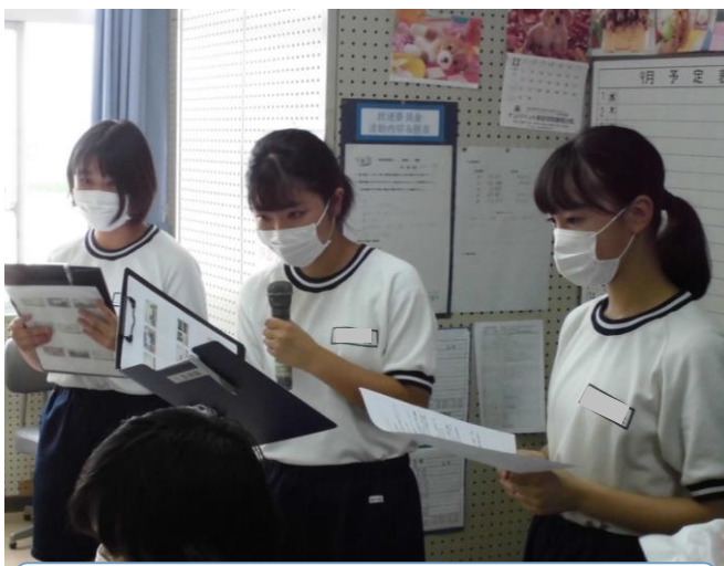
リモート形式の集会にも慣れてきました