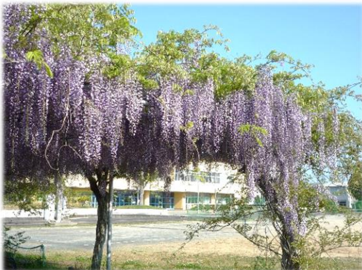
【綺麗に咲いた正門東の藤棚 4月末】