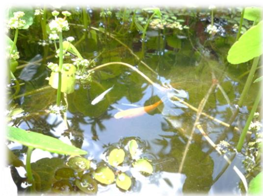
【6A組前の池のメダカ】